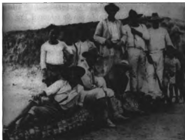
Sentado en un caimán