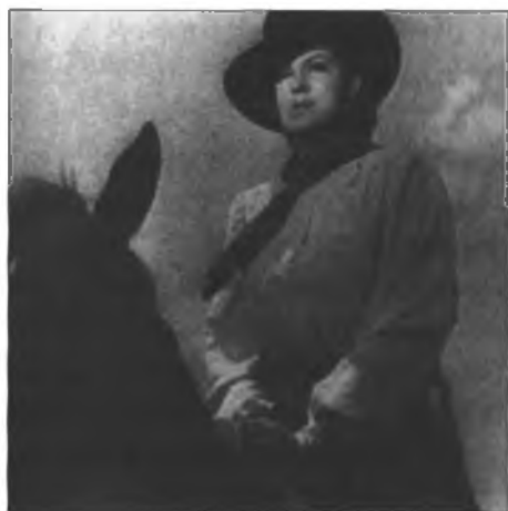
María Félix, Doña Bárbara