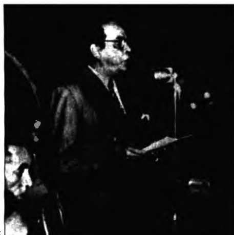
Rómulo Gallegos en una de sus intervenciones públicas