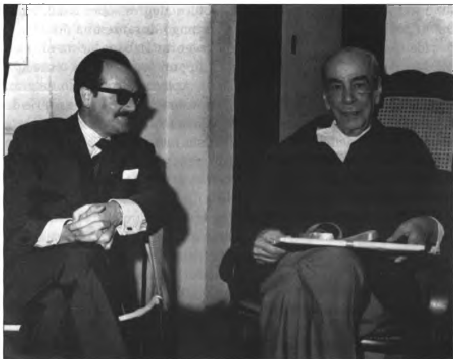
Simón Alberto Consalvi con Rómulo Gallegos

Fueron los últimos once años de la vida de Gallegos, cada día más retirado, en busca de la soledad, al pie del Ávila de sus excursiones juveniles, de sus metáforas deslumbrantes, de su amor pasional por la tierra. Su corazón se fue rindiendo, tenía 85 años. A las 2 y 20 minutos de la madrugada del 5 de abril, Sábado de Gloria de 1969, murió el primer venezolano del siglo XX, en los brazos de sus hijos Sonia y Alexis.