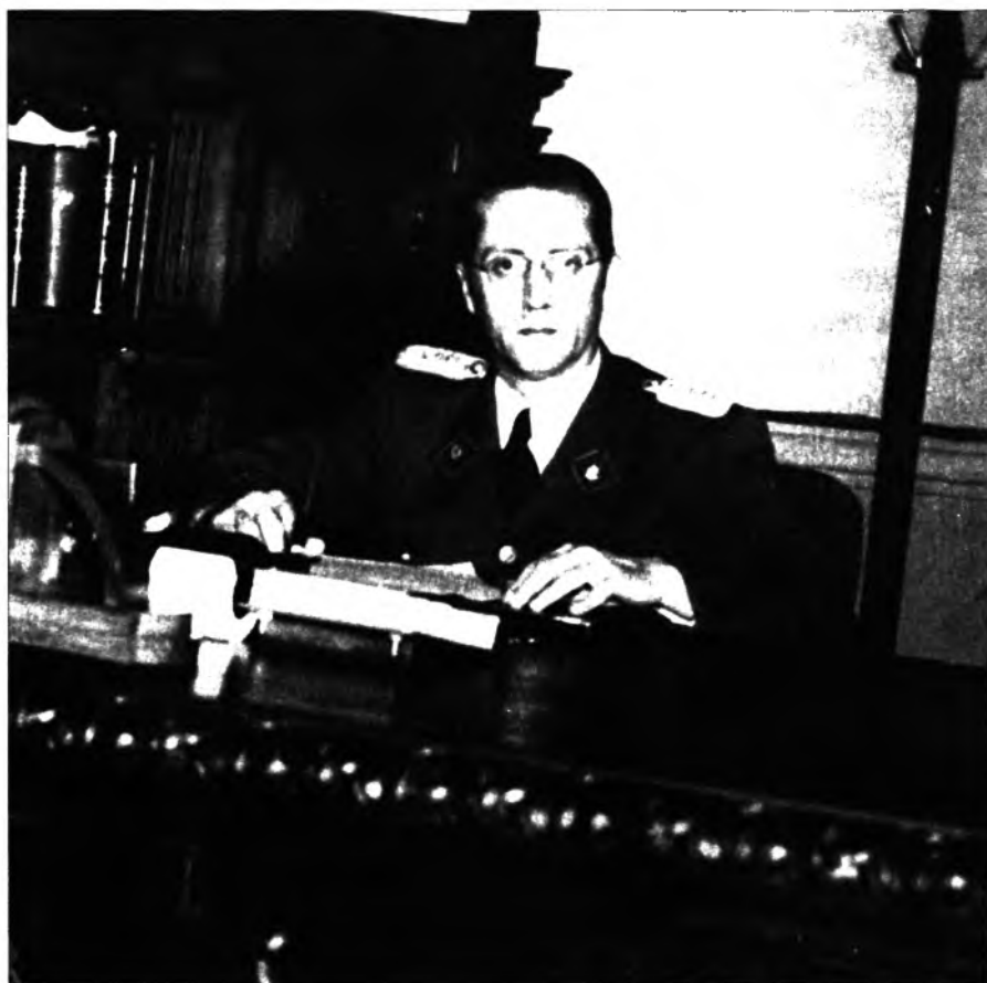
Carlos Delgado Chalbaud

tum y se esforzó en proclamar la “absoluta normalidad en toda la República”, confiado, quizás, en la lealtad y la palabra de su Ministro de Defensa, y textualmente le dijo a Otero Silva: “Ni estoy caído, ni en plan de huida, amigo mío. Usted mismo me ha encontrado en pantuflas. Y las pantuflas no se usan para correr, -concluyó sonreído”.