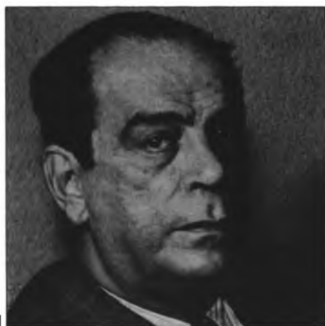
Rómulo Gallegos en la década de 1940