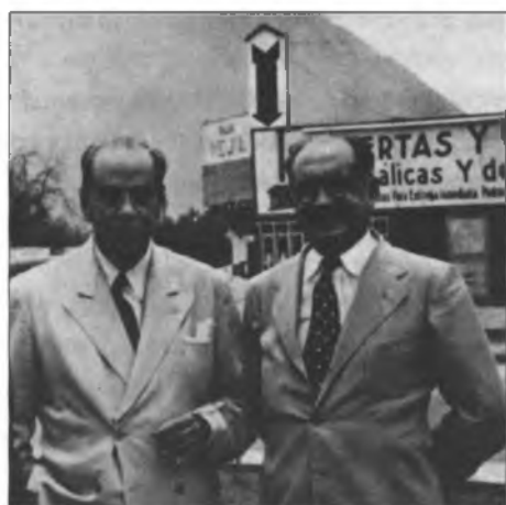
Rómulo Gallegos con Andrés Iduarte