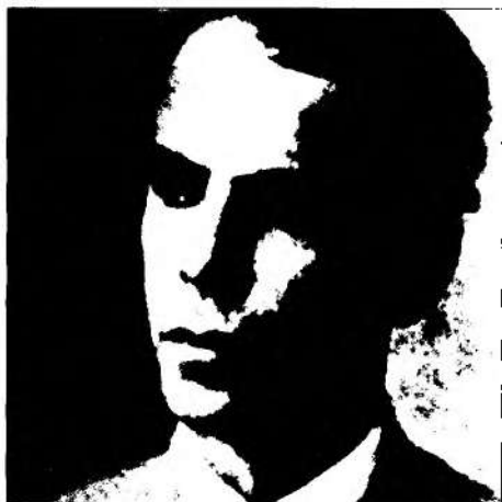
Rómulo Gallegos en la década de 1910