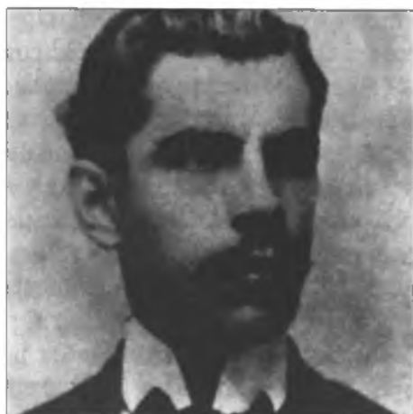
Rómulo Gallegos (c. 1909)