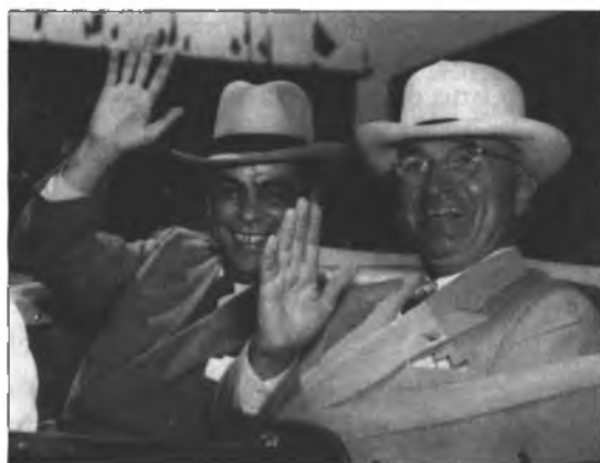
Rómulo Gallegos con el Presidente Harry S. Truman, 1948