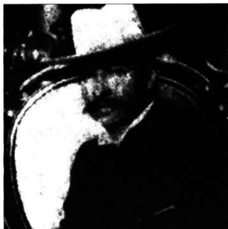
Juan Vicente Gómez