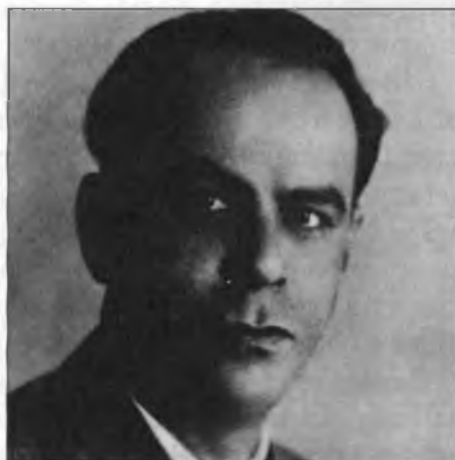
Rómulo Gallegos [c. 1912]