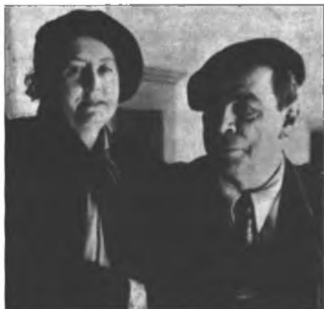
Rómulo Gallegos y su esposa Teotiste en su estancia española